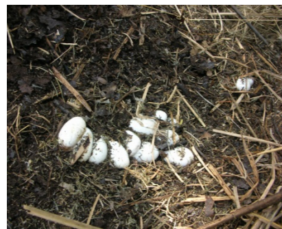
Abbildung 3 Material eines genutzten Eiablagehaufens. In der Mitte ein frisches Gelege.