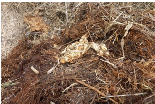
Abbildung 2 Material eines genutzten Eiablagehaufens. In der Mitte ein altes Gelege.

Achtung: Keine Neophyten wie Goldrute oder Springkraut verwenden. Dieses Pflanzgut im Kehricht entsorgen.